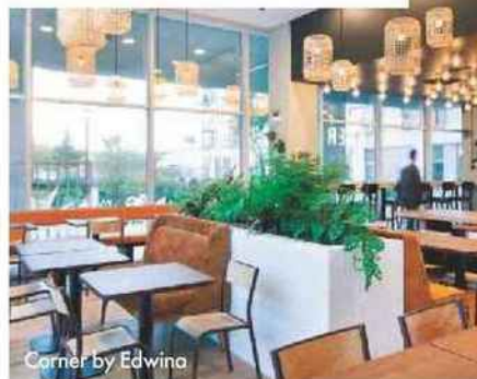
Corner by Edwina

Edwina travaille des produits raisonnés, frais et énergétiques, ajoute des super aliments (spiruline, curcuma frais, badiane, gingembre...) et prépare le pain de ses panozzos. On y va pour son bouillon de mâche et cresson épicé, très herbacé, et ses poireaux vinaigrette à la grenade, ou pour un filet de poulet français mariné et grillé, avec du fenouil rôti et une sauce aux herbes fraîches. Formules à partir de 12,50 €. Pour le déjeuner uniquement, sur place ou à emporter. 8, rue Magdeleine, Nantes. Tél. : 02 28 44 57 31. cornerbyedwina.fr