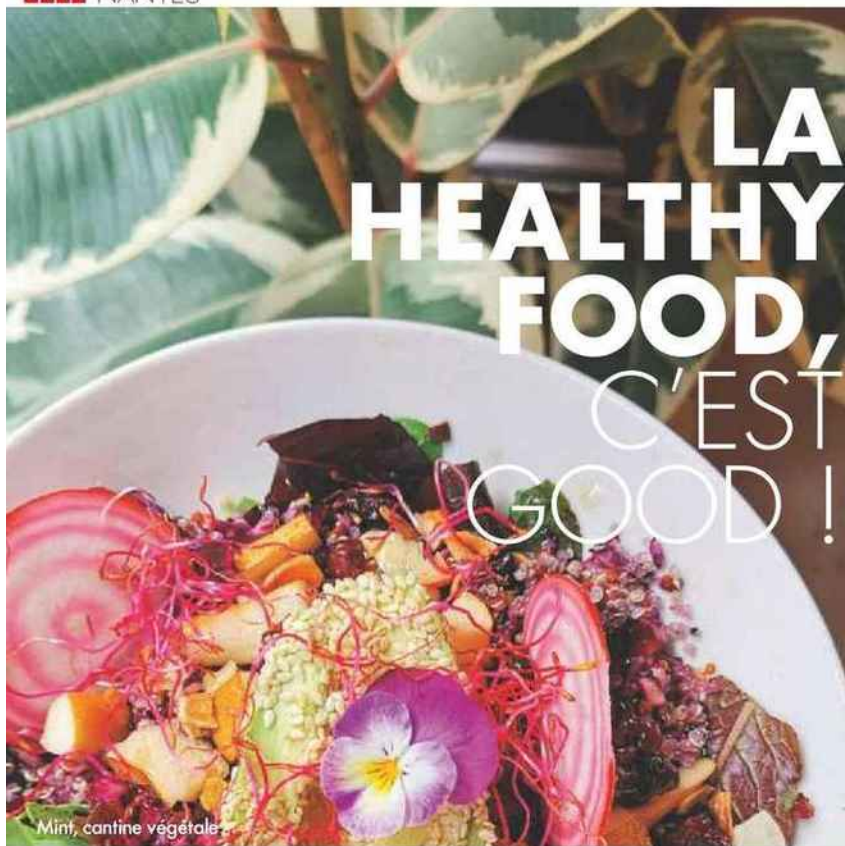
Mirif, cantine végétale