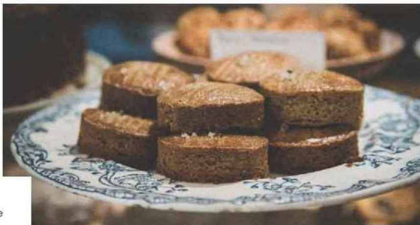
Maison Arlot Cheng

Elles sont effectivement deux Pauline, et leur jolie boutique au charme rétro regorge de beaux produits gourmands : des laitages, des fromages, du riz au lait, des farines et toutes sortes de légumineuses, des pains aux graines de courge, au petit épeautre ou briochés, des farines, des pâtes, du riz, des légumineuses, des cafés et thés, des bonbons bio aux fruits, des biscuits, des chocolats et des épices... Et le jeudi, on pense à réserver son panier de fruits