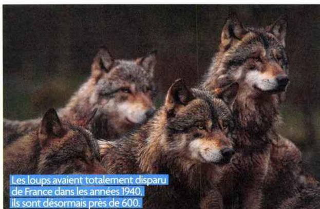
Les loups avaient totalement disparu de France dans les années 1940, ils sont désormais près de 600.

la population française compte plus de 15 000 individus répartis sur une cinquantaine de départements.