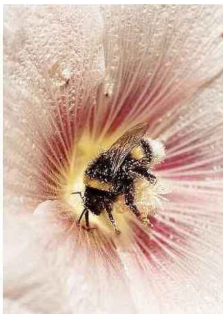
Un bourdon dans une rose trémière