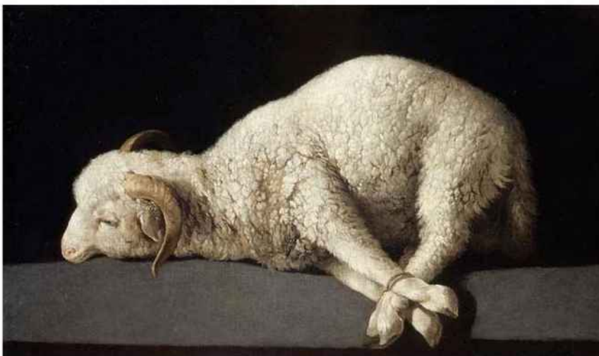
Symbolique chrétienne par excellence : l'agneau, ici peint par Zurbaran.