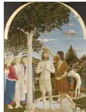
Le Baptême du Christ – National Gallery, Londres

Peintre de ville et peintre de cour, auteur d'un mythique cycle de La Légende de la vraie Croix (Arrezzo) mais aussi figure familière de la Rome des papes humanistes puis « monarque de la peinture » à Urbino : Piero della Francesca laissa, au-delà de son œuvre peinte, un héritage qui, sous la forme d'un traité de perspective, en fait l'un des grands penseurs de l'art. « Le meilleur géomètre de son époque » dira Vasari. Ce dont rend admirablement compte l'abondante iconographie.