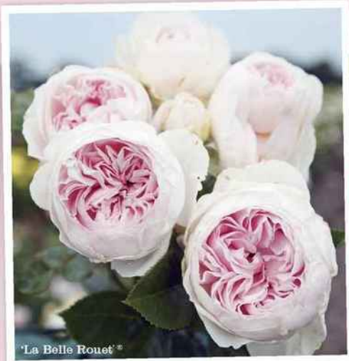
'La Belle Rouet'®

18 € le rosier à racines nues. Globe Planter, 45500 Gien. Tél. 02 38 29 54 55. www.globeplanter.com