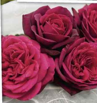
'Madame de Montespan'®