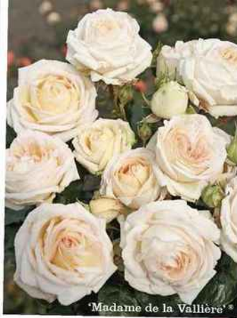
'Madame de la Vallière'®