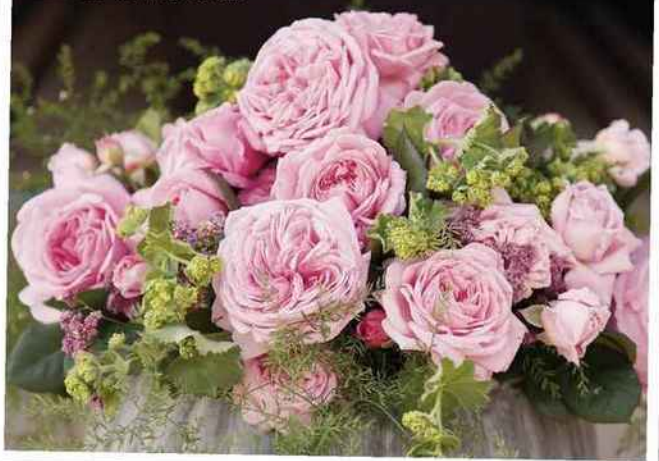
'Madame de Maintenon'®

Les roses de la collection 'Parfuma'® associent de superbes fleurs bien doubles à une très bonne résistance aux maladies et des parfums remarquables. Elles portent toutes le nom d'une favorite de rois de France, de François I er à Louis XIV. 'Madame de Montespan'®, rouge pourpré, et 'Madame de la Vallière'®, crème rosé, ont déjà obtenu le prestigieux label allemand ADR, décerné aux variétés les plus