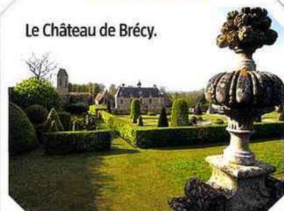
Le Château de Brécý.