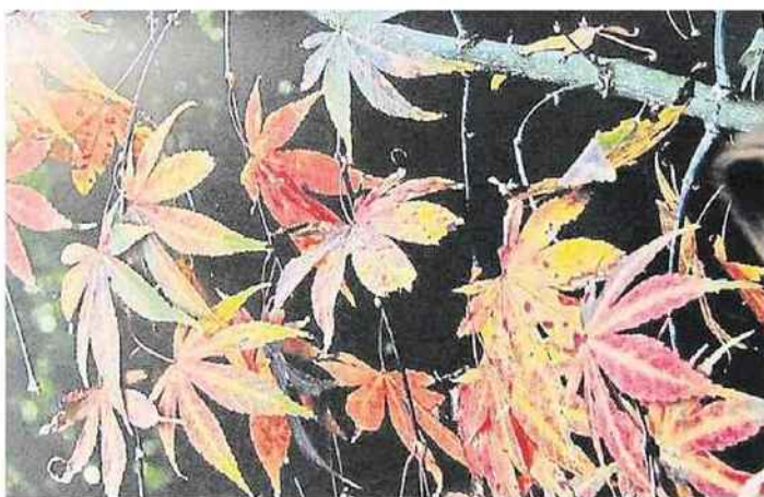
L'acer palmatum « Shindershojo », dont les feuilles tombées composent un superbe tableau japonais