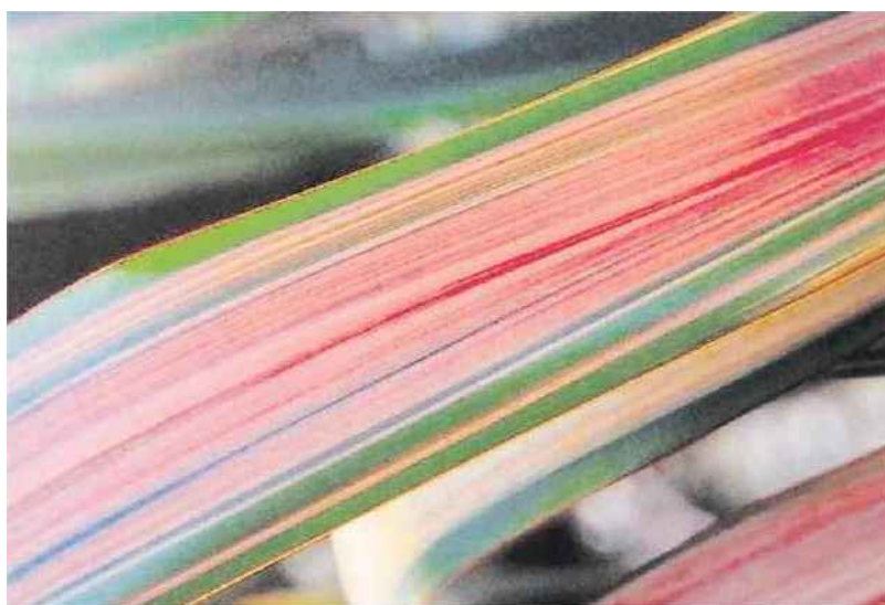
Le phormium jester et ses étonnantes couleurs