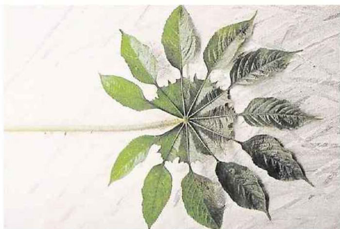
L'extraordinaire brassaiopsis mitis un chef d'œuvre de la nature