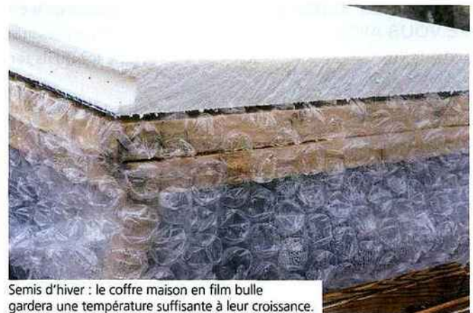
Semis d'hiver : le coffre maison en film bulle gardera une température suffisante à leur croissance.

pour les radis, les carottes, les salades. Sous le tunnel, en étant à l'abri de quelques degrés par rapport à l'extérieur, la végétation reste active. On peut ainsi avoir des radis à Noël et sans chauffage !