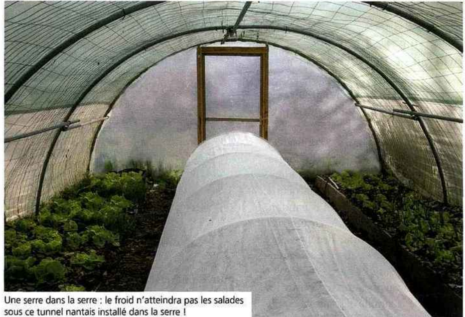
Une serre dans la serre : le froid n'atteindra pas les salades sous ce tunnel nantais installé dans la serre !