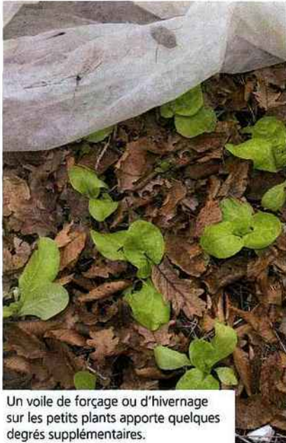
Un voile de forçage ou d'hivernage sur les petits plants apporte quelques degrés supplémentaires.