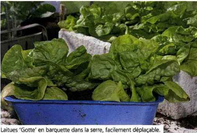
Laitues 'Gotte' en barquette dans la serre, facilement déplaçable.